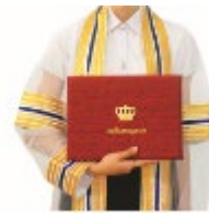
๒. ม้วนปริญญาบัตรแนบกับอก