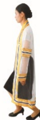
บัณฑิตหญิง ถอนสายบัว